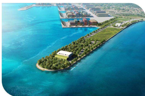
Accès nord au tunnel.

Bouygues Construction, à travers ses filiales Dragages Hong Kong et Bouygues Travaux Publics, vient de remporter un contrat de 1,15 milliard d'euros pour la réalisation d'un tunnel routier sous-marin de 4,2 km de long à Hong Kong. Il s'agit du marché de conception-construction le plus important jamais attribué à Hong Kong.