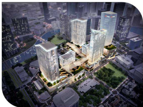
Le complexe sera équipé du dispositif « Climate Ribbon™ » (ruban climatique), créé par Swire Properties. Il s'agit d'un treillis composé d'acier, de tissu et de verre, qui reliera les bâtiments et couvrira 14 000 m 2 de zone commerciale extérieure.

Americaribe, filiale américaine de Bouygues Construction, vient de remporter en groupement avec l'entreprise américaine de construction John Moriarty & Associates of Florida un contrat d'environ 520 millions de dollars (400 millions d'euros) pour la réalisation de la première phase d'un projet multi-usages à Miami pour Swire Properties, l'un des promoteurs immobiliers internationaux majeurs de la Floride du Sud. La part d'Americaribe s'établit à près de 260 millions de dollars (environ 200 millions d'euros).